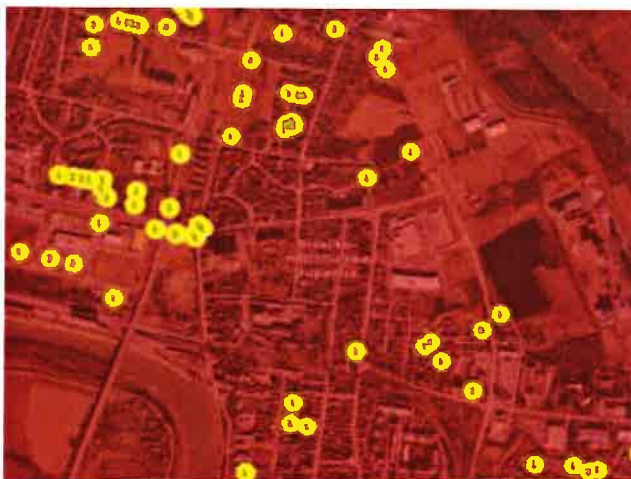
Poredbene vrijednosti-žute markice