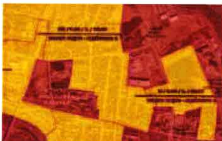
Približna vrijednost po MGIPU